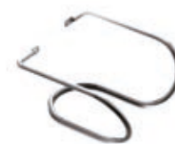
FSPM Supporto parete mini per combi 250 Wall support mini for combi 250