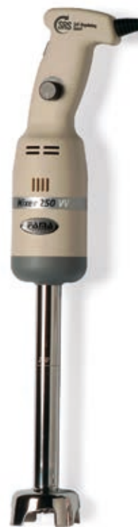
Mescolatore Blending Tube 250 mm