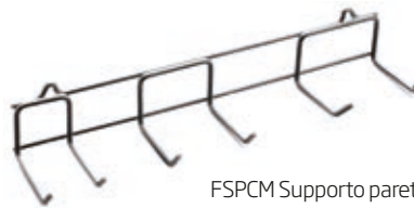
FSPCM Supporto parete mini per mixer 250 Wall support for mixer 250

Lame in acciaio INOX facilmente intercambiabili S/steel easy interchangeable blades