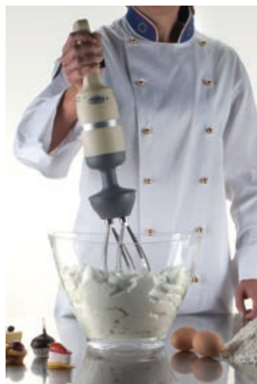
Nuova frusta New whip

Estrema facilità di smontaggio utensile Impugnatura ergonomica Variatore di velocità