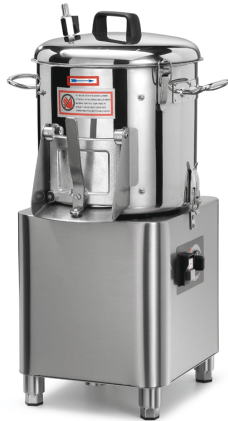
Sirman Картофелечистки , model PPJ 6 SC :

Sirman Spa Viale dell'Industria 9/11 35010 PIEVE DI CURTAROLO (PD), Italy Tel./Fax. +39 049 9698666 / +39 049 9698688 email: info@sirman.com